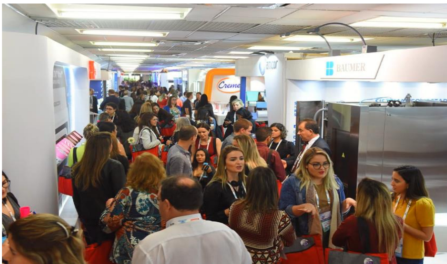
Exposição Tecnológica 2018