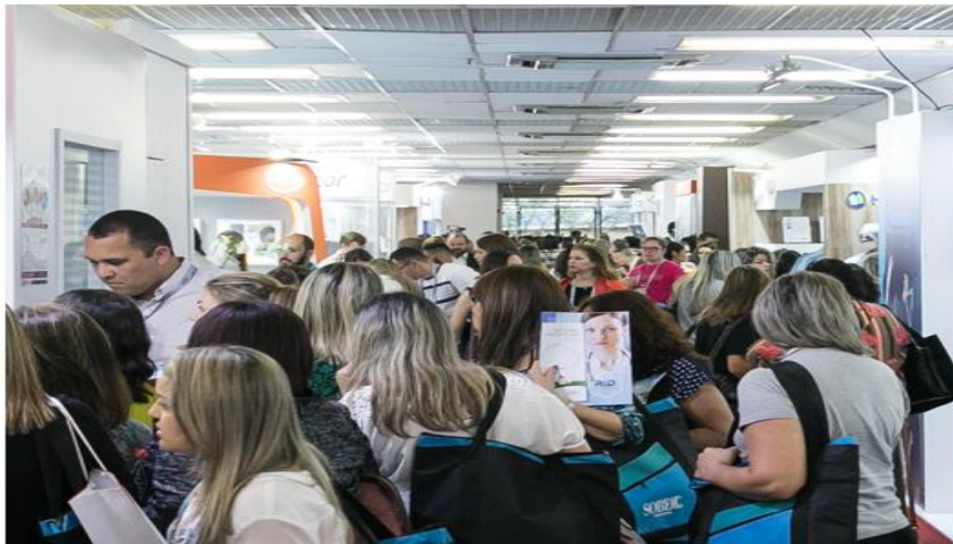
Exposição Tecnológica 2017