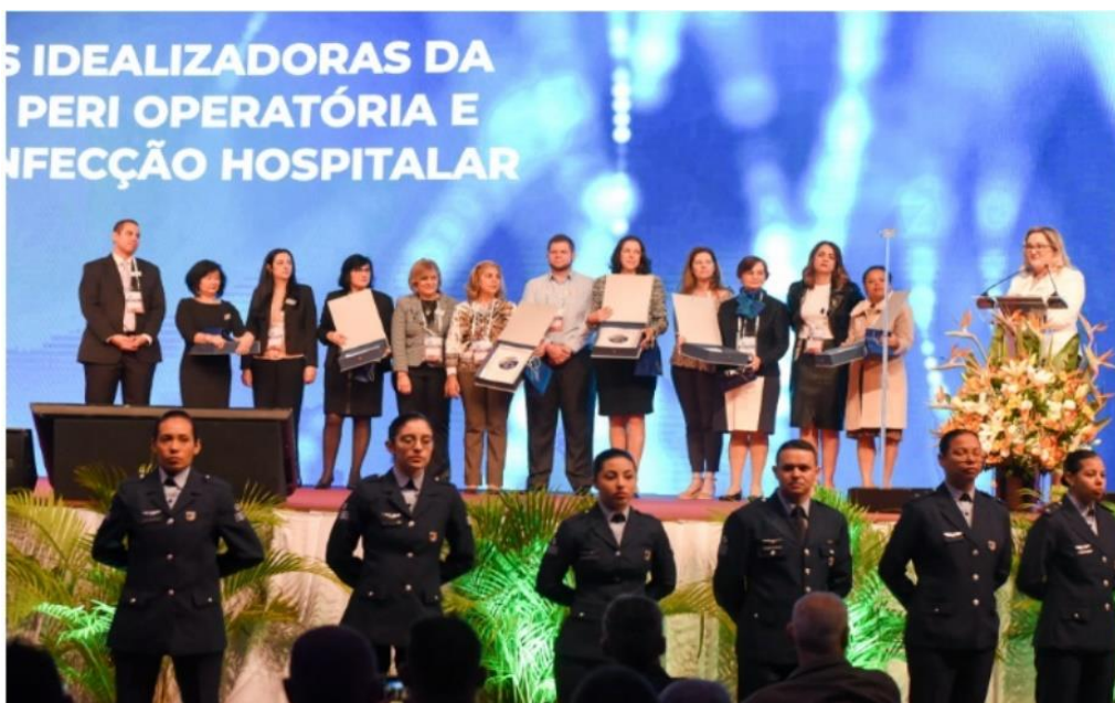
Cerimônia de abertura homenagem as fundadoras da Associação 2018

Expectativa de público: 1800 a 2200 participantes.